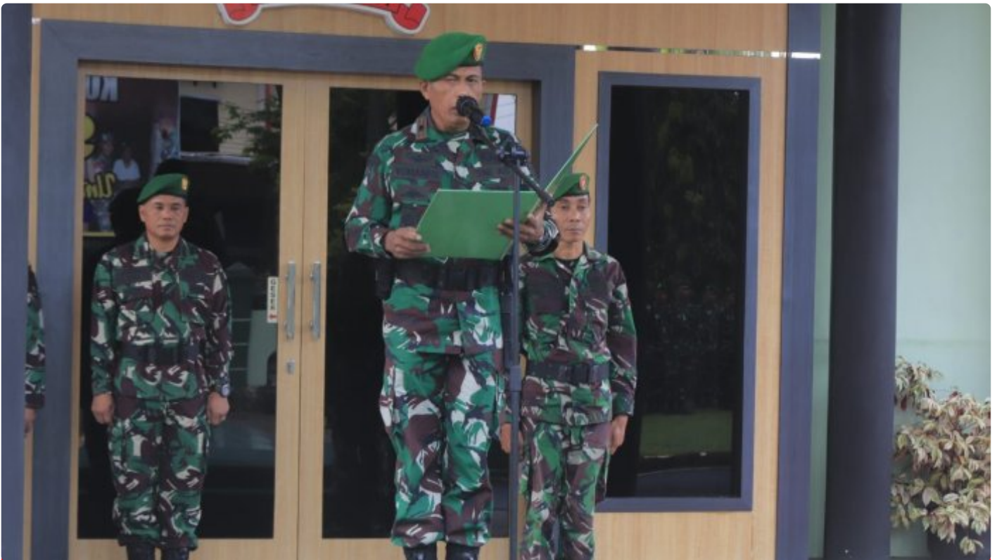
Makna Upacara Bendera Merah Putih Dibulan Suci Ramadhan Bagi Prajurit Kodim 1006/Banjar

MARTAPURA - Bagi Prajurit TNI AD Upacara Pengibaran Bendera Merah merupakan suatu keharusan dilaksanakan.